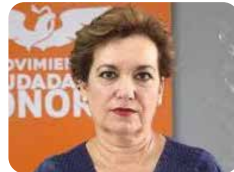
Dolores del Río Sánchez

Cuando parecía que este era un tema agotado, al menos hasta que apareciera la convocatoria de Morena y sus partidos aliados, pero al parecer los partidos políticos en general no pretenden continuar con este tema, por varios motivos, el de mayor importancia nos dicen es, hasta no quedar totalmente definido el cómo quedará la reforma electoral.