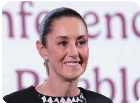
Claudia Sheinbaum Pardo